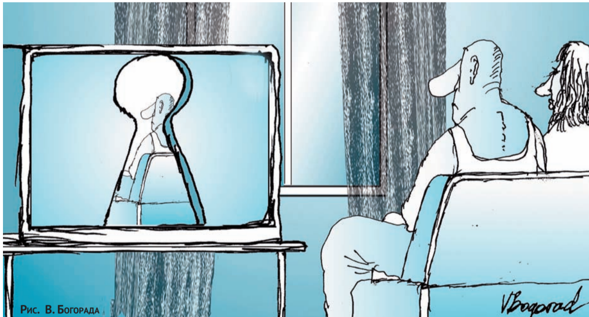
Рис. В. Богорада

На этом предлагаю тему считать закрытой. Главная цель публикации — предупредить — надеюсь, достигнута. Давайте учтем точку зрения Палеонтологического института, руководство которого, согласно фильму, украло из Музея все кости. «Извините, но мы себя не на помойке нашли, чтобы, как выражаются в Интернете, «кормить троллей». Есть репутация у нашего Института и Музея, и есть репутация у телеканала РЕН-ТВ — обе они общеизвестны. Помните Ходжу Насреддина: «Он уже успел подсчитать, что в этой беседе со стражником каждое слово обходится ему дорожке десяти таньга» — так вот это тот самый случай».